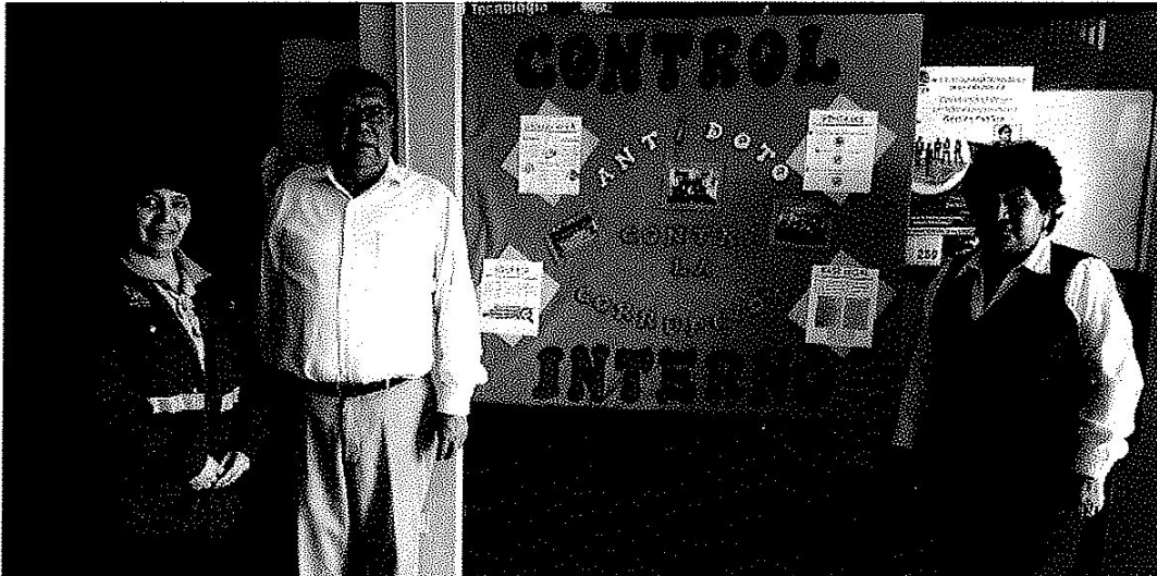
IMAGEN 04 – PERIODICO MURAL EN LA GERENCIA DE DESARROLLO SOCIAL